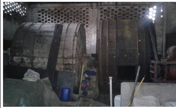
Foto No. 3 Bombos de proceso húmedo sin funcionamiento.