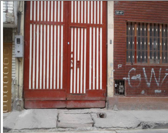
Foto No. 1 Fachada del establecimiento.