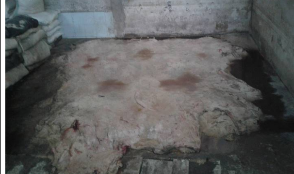
Foto No. 4 Almacenamiento de pieles frescas, se evidencia generación de ARND que se descargan hacia la trampa de grasas.