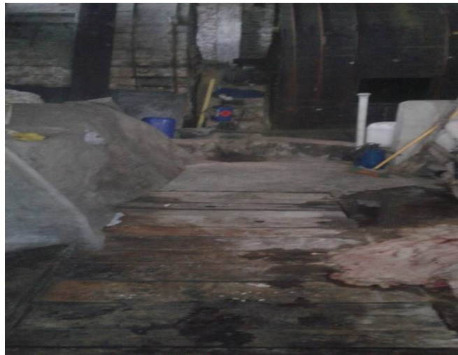
Foto No. 5 Sistema de tratamiento de ARND.

LA ACTIVIDAD REALIZADA POR EL USUARIO ES GENERADORAS DE ARND..... SI NO